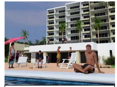
Presentación virtual de un proyecto de hotel.