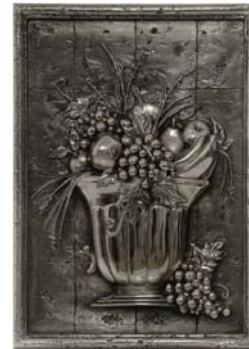
Azulejo de Torogoz; diseño co-financiado por el programa. A la fecha, han exportado alrededor de $25,000 de esta nueva línea de azulejo decorativo.

El programa apoya a aquellas personas y empresas que desean registrar sus diseños y productos. Esto se logra a través de asistencia técnica co-financiada, cobertura de gastos legales, consultoría de diseño y desarrollo de nuevos productos.