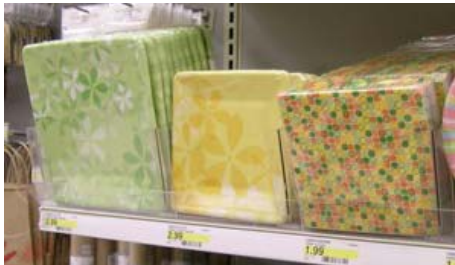
Platos y servilletas desechables con diseño de Emma Schonenberg en venta en las tiendas Target, Estados Unidos.